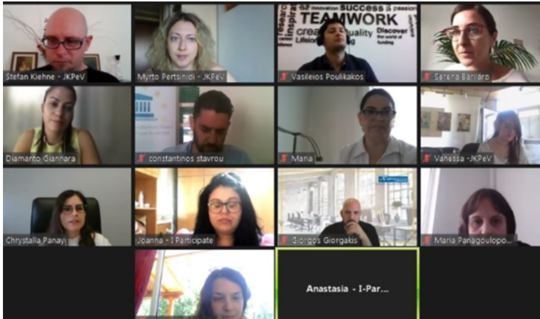
Project Meeting, 15 giugno 2021